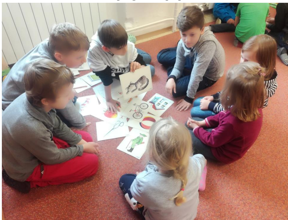
obr. č. 5 – Předškoláci ve škole, program si připravila třída 4. E (březen 2019)

Velké poděkování patří řadě pedagogických pracovníků, kteří se svým profesionálním přístupem podíleli na organizaci a bezproblémovém průběhu zápisu. Také je potřeba poděkovat těm rodičům, kteří se k průběhu zápisu postavili věcně, s nadhledem a zároveň jim děkujeme za vstřícnost a pochopení u všech procesních úkonů spojených se zápisem k základnímu vzdělávání.