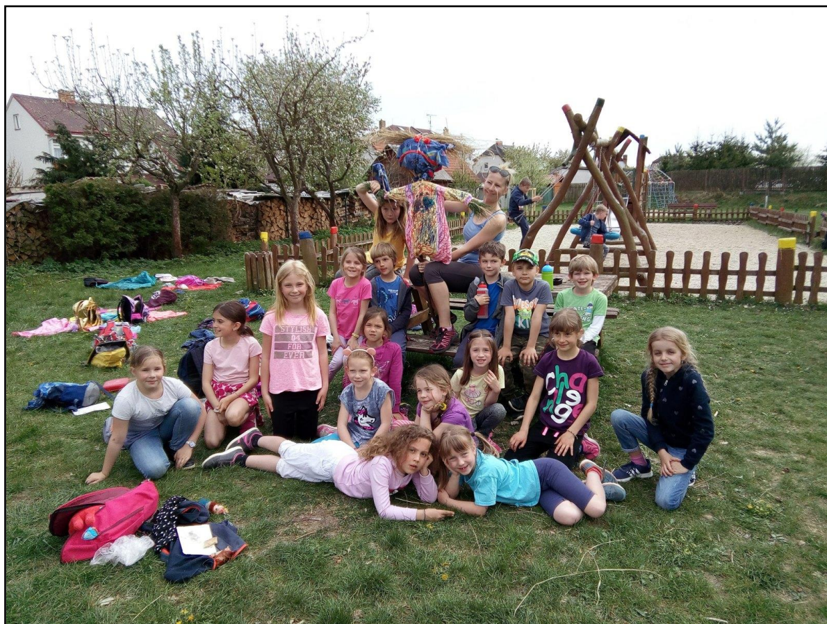
obr. č. 7 – činnost školní družiny – Pálení čarodějnic (duben 2019)