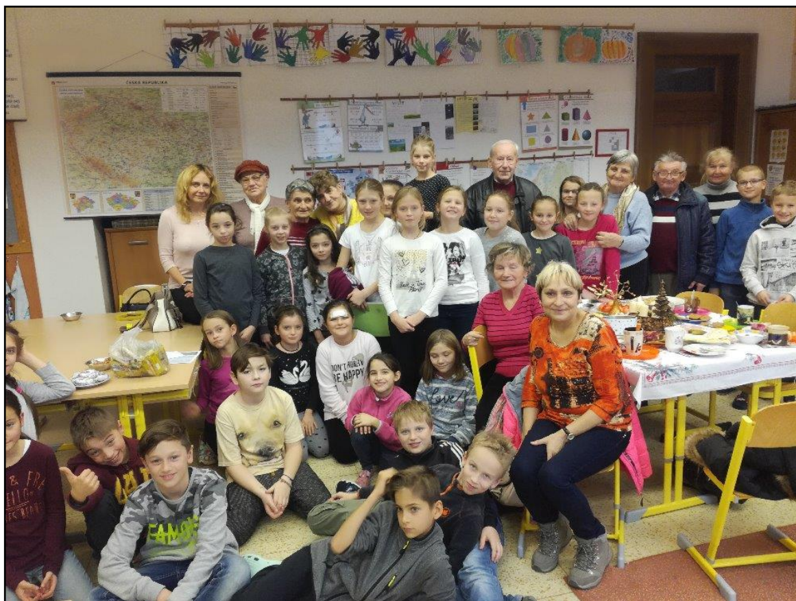
obr. č. 13 – Vánoční besedu se seniory si připravila třída 4. E (prosinec 2018)

Přehled akcí ve školním roce 2018/2019 je přílohou této výroční zprávy.