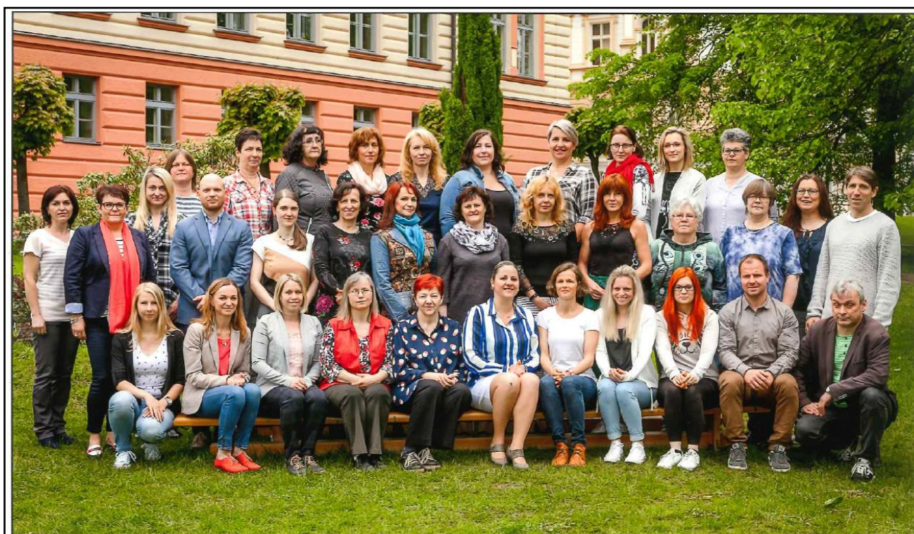
obr. č. 4 – Pedagogický sbor ve školním roce 2018/2019 (květen 2019)