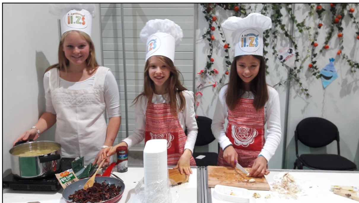
obr. č. 12 – Prezentace školního vaření žáků na akci „Gastrofest“ (listopad 2018)

Další důležitou oblastí, ve které se snaží zřizovatel svým školám pomáhat, je oblast školního stravování. Jednou z aktivit této podpory je například realizace projektu „Jak se vaří zdraví“ – v rámci tohoto projektu Město Jindřichův Hradec uspořádalo pro zaměstnance školních jídelen besedy s odborníky v oblasti školního stravování a také zorganizovalo prezentaci vaření pro personál školních jídelen jindřichohradeckých mateřských a základních škol. Významnou a veřejností velmi kladně hodnocenou akcí byla účast jindřichohradeckých základních škol na Gastrofestu v Českých Budějovicích v listopadu 2018, kde své kulinářské umění prezentovaly kuchařky ze školních jídelen ZŠ v Jindřichově Hradci a chutné pokrmy vařili také jejich žáci.