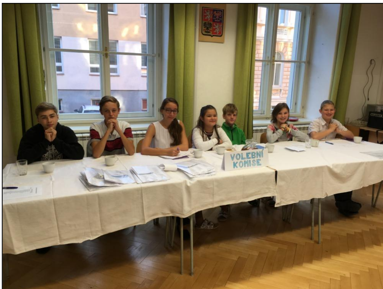
obr. č. 3 – Volby do školního žákovského parlamentu (říjen 2018)