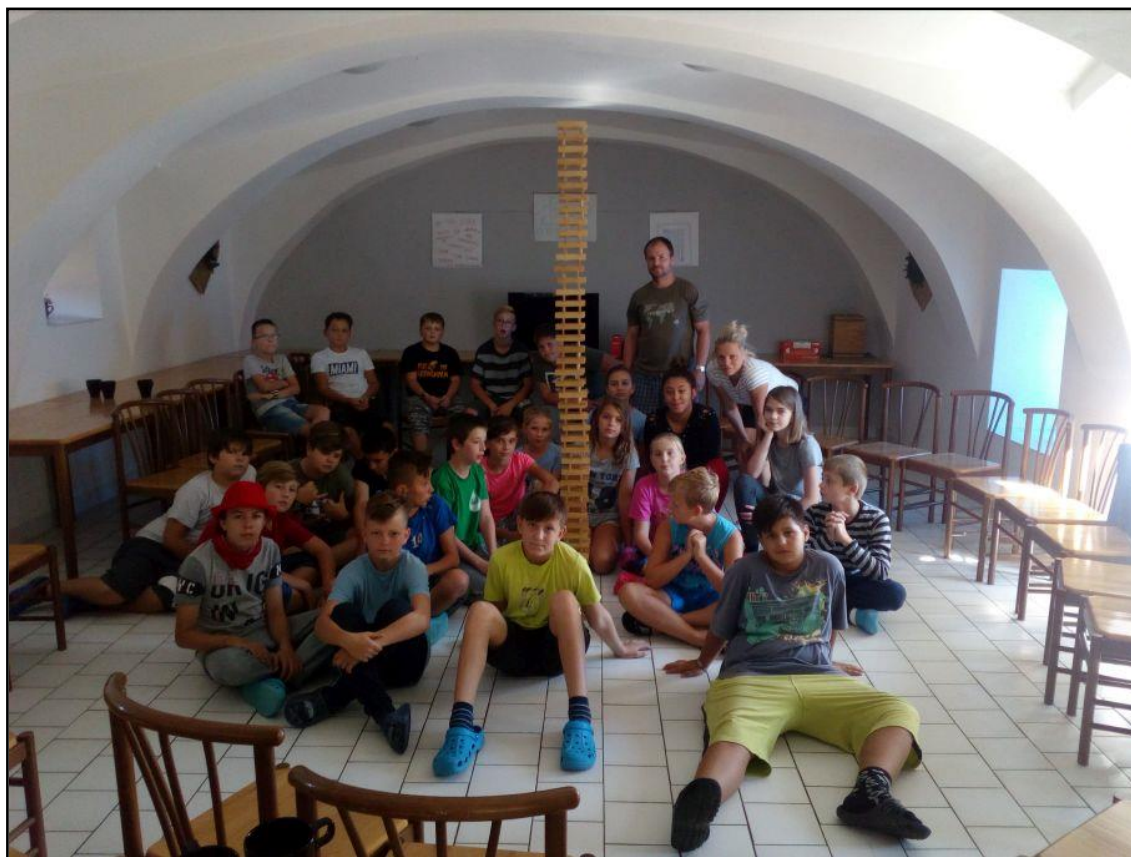
obr. č. 2 – Adaptační pobyt třídy 6. A (září 2018)