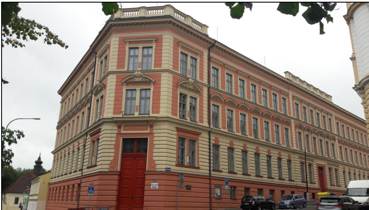
obr. č. 1 - Budova Základní školy Jindřichův Hradec II, Janderova 160 (srpen 2017)