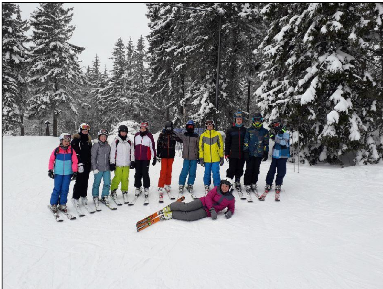
obr. č. 6 – Lyžařský výcvik 7. ročníku v Deštném v Orlických horách (leden 2019)

O řešení kázeňských problémů byli vždy informováni zákonní zástupci příslušných žáků, kteří ve většině případů škole poskytli patřičnou součinnost při projednávání dané situace. Škola se při řešení výchovných problémů žáků řídila platnou legislativou, doporučeními odborných institucí (MŠMT, PPP, OSPOD...) a postupovala také v souladu s vnitřními směrnici a postupy.