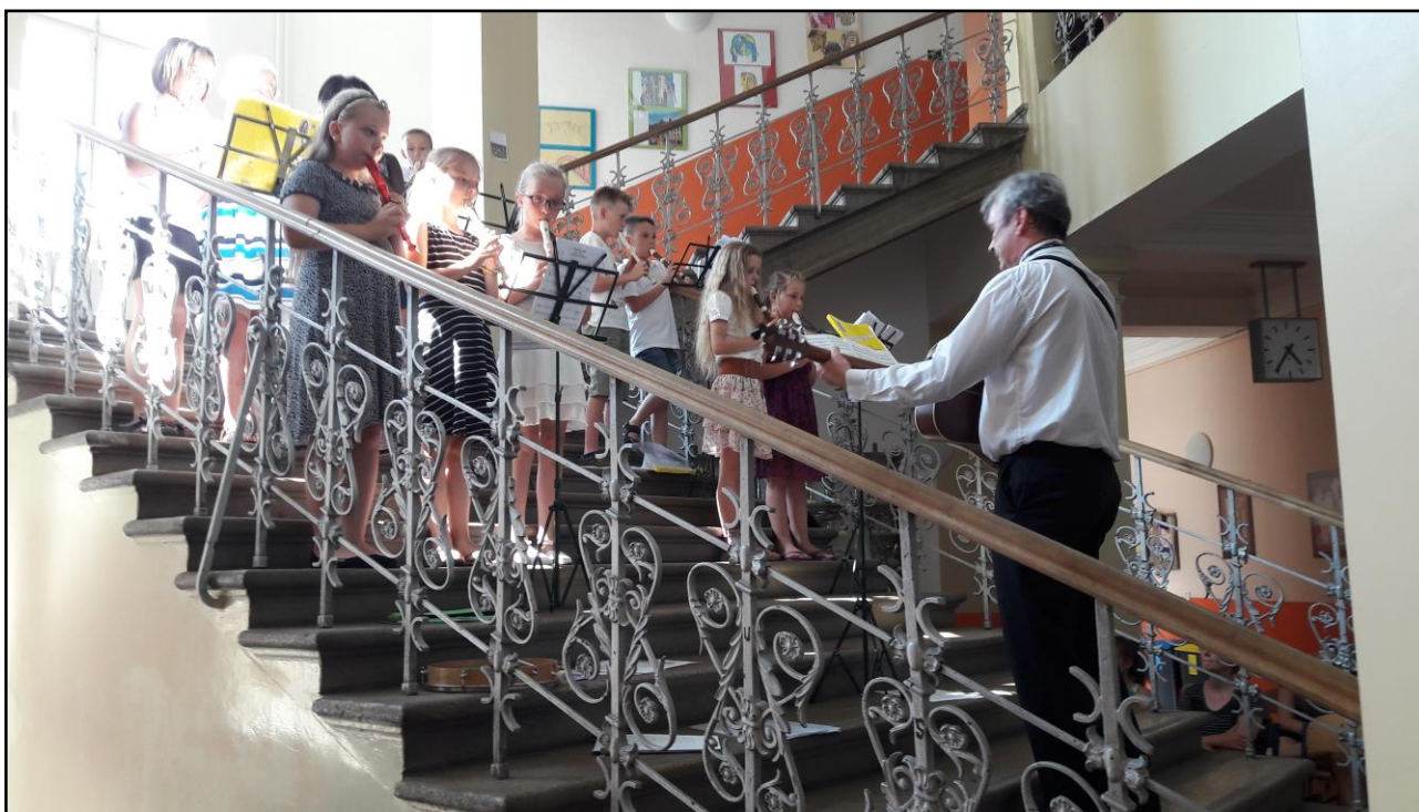
obr. č. 10 – Koncert žáků pro rodiče k závěru školního roku 2018/2019 (červen 2019)

V průběhu roku se také speciální pedagožka zúčastnila přednášky pořádaných školou pro rodiče žáků se zaměřením na Kyberšikanu a účastnila se také dalších školních akcí.