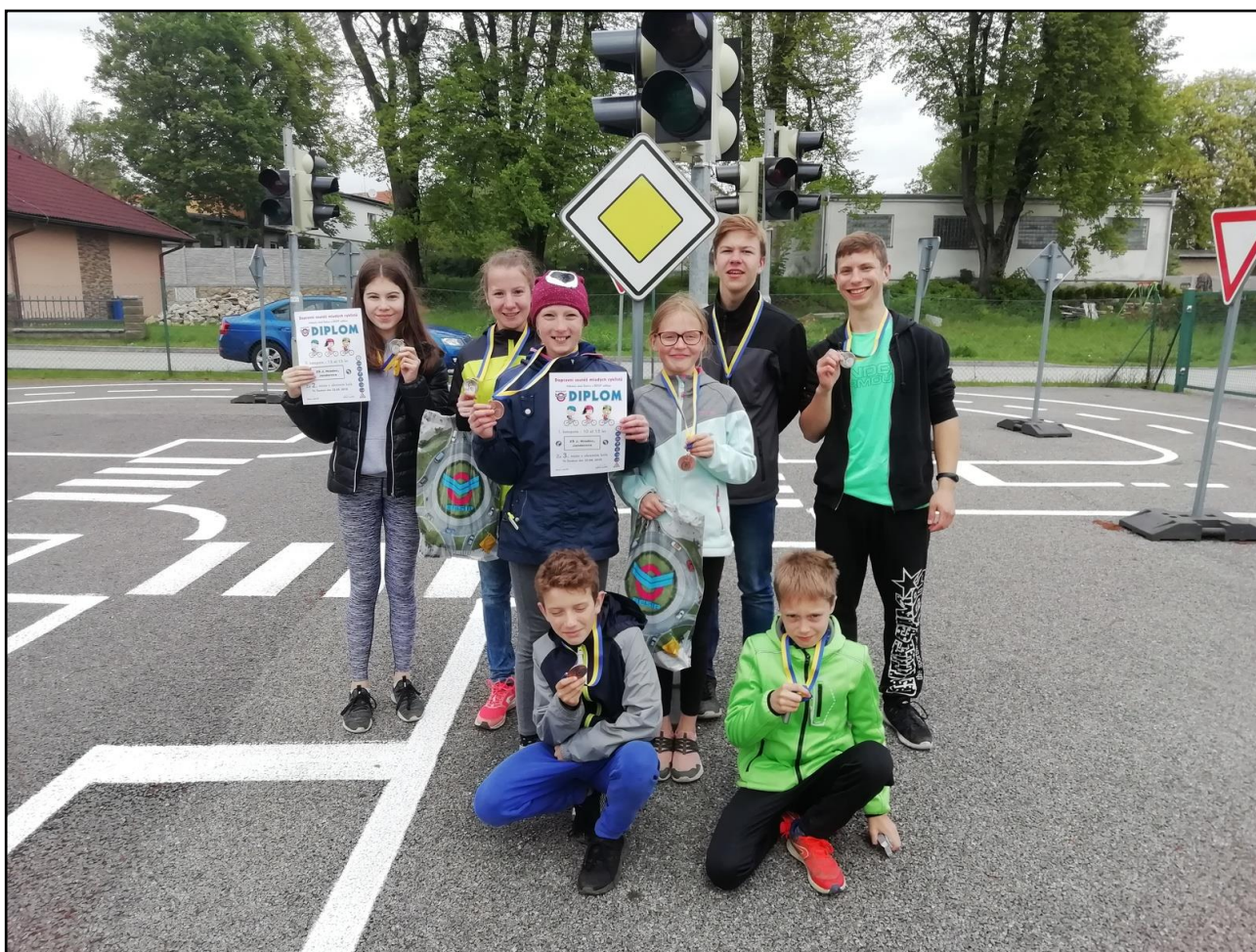
Obr. č. 18 – Úspěšní žáci na oblastním kole dopravní soutěže mladých cyklistů (duben 2019)

V průběhu školního roku se škola musela potýkat s několika případy dlouhodobé pracovní neschopnosti. Přes náročnou situaci zejména v posledním čtvrtletí školního roku se podařilo pedagogickému sboru a dalším pracovníkům školy úspěšně zvládnout školní rok. Závěrem lze konstatovat, že úkoly a cíle, které byly na začátku školního roku stanoveny, se podařilo splnit, za což patří poděkování všem pedagogickým i nepedagogickým pracovníkům školy a také organizacím a osobám, které s naší školou spolupracovaly.